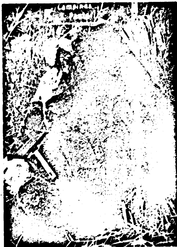
Foto 2 - Local onde foram realizadas as amostragens. Coleta de seixos e da matriz dos metaconglomerados.