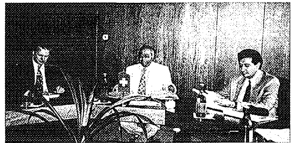
Švajčiarska vláda sa podieľa na podpore ÚJD SR v oblasti bezpečnostných analýz a technického vybavenia Swiss Government is sharing support of ÚJD SR in the field of safety analyses and technical equipment

Swiss Federal Nuclear Safety Inspection Authority (HSK): The „HSK and ÚJD SR Co-operation Project“ was signed on August 2nd, 1996 in Bratislava. General objective of this co operation aims to providing assistance at forming and training a group for safety analysis in framework of the Swiss technical assistance. This project is financially supported as a part of Swiss Government Supportive Programme in order to help Eastern countries and the project will provide ÚJD SR with support in the area of nuclear power plants independent safety analysis. Two-week training course on computing codes utilization was held in November as the part of this project.