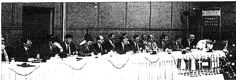
Stretnutie predstaviteľov dozorov európskych krajín (CONCERT) sa konalo po prvý krát v Bratislave Meeting of representatives of regulatory authorities of European countries (CONCERT) held for the first time in Slovak Republic