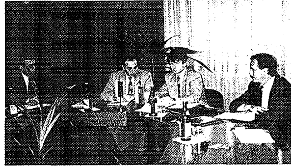
Príprava technickej pomoci ÚJD SR Arménskemu jadrovému dozoru Preparation of technical assistance of ÚJD SR for the Armenian Nuclear Authority

odborníkov zo SR do procesu riešenia problému nakladania aj s inštitucionálnymi rádioaktívnymi odpadmi.