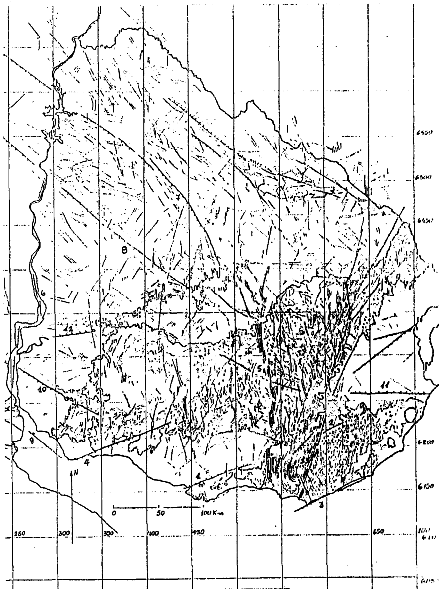
Figura N° 1.