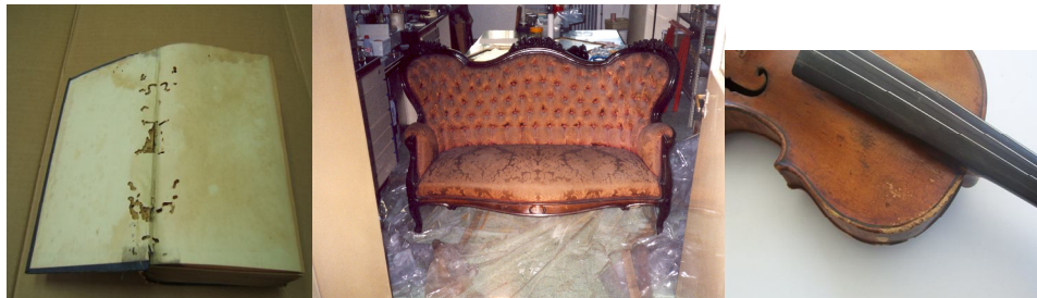
Libro, sillón e instrumento musical infestados

Los productos con valor cultural particularmente, presentan condiciones atractivas para una importante cantidad de especies artropódicas debido a que durante el tiempo transcurrido desde su elaboración se han acumulado rastros de diferentes almacenajes, de transporte, manejo, etc. variables que pueden favorecer la llegada de estos agentes perniciosos.