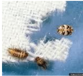
Anthrenus spp. en alfombra

Orugas de gorgojos y escarabajos pertenecientes a las familias Curculionidae , Cerambycidae , Anobiidae , Dermestidae y otras, son tremendamente voraces en su etapa larvaria causando la parcial o total destrucción del tejido en el que han depositado sus huevos. Cavan galerías en el interior del cuero, madera, cartón y otros productos orgánicos, llegando a afectar de modo directo las propiedades físico-químicas del material y luego daños indirectos por la generación de polvillo, sustrato en el que se desarrollan plagas insectiles secundarias y ácaros. Las especies del orden Coleoptera pueden desintegrar y acabar con una importante parte de nuestro patrimonio cultural.