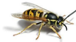
Avispa Polistes fuscatus

Otros insectos dañinos que pueden afectar el acervo cultural son los correspondientes a los ordenes Hymenoptera (avispas), Isoptera (hormigas carpinteras, termitas) y Diptera (moscas). Estas formas se definen como “plagas migratorias”, es decir si bien necesitan ese medio para sostener su vida generándole daños desde leves hasta severos y de diferente tipo (por humedad, manchas, etc.), no desarrollan su vida dentro de él.