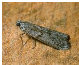
Ephestia spp adulto

Las polillas Tinea spp, Tineola spp, Anagasta spp y otras depositan sus huevos sobre los tapices, atuendo, alfombras, cortinados, etc. Luego de la eclosión las larvas se alimentan de esas fibras con el fin de incorporar queratina \alpha y \beta , colágeno, elastina y fibrina (proteínas animales fibrosas o escleroproteínas) que necesitan para la prosecución de su ciclo biológico.