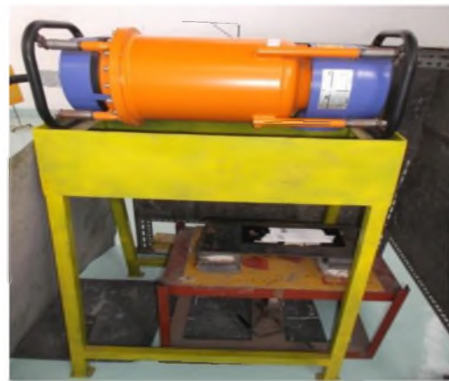
Gambar 4. Pembangkit sinar-X Rigaku dan posisi terumbu karang.