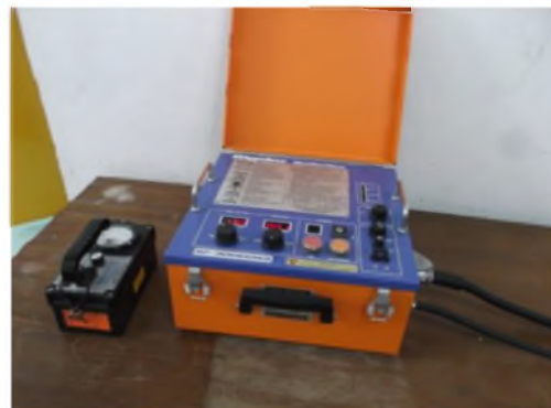
Gambar 5. Panel pengendali dan Surveymeter .