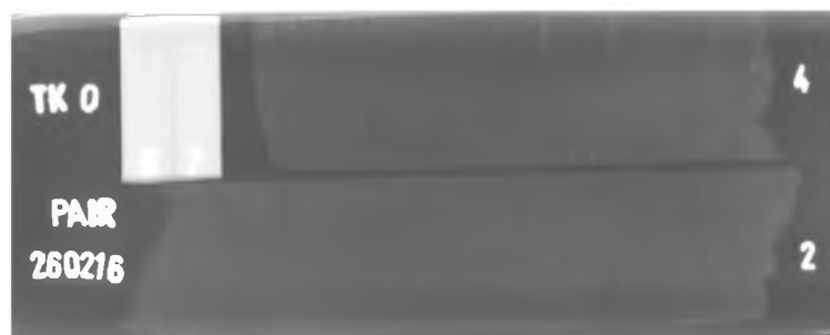
Gambar 6. Hasil pemindai film radiografi pada terumbu karang

signifikan disebabkan karena terumbu karang mempunyai tingkat kualitas kepadatan yang tinggi dan tingkat kekeroposan yang rendah. Pengolahan dan pemotongan terumbu karang yang handal, teliti, dan akurat juga dapat mempengaruhi porositas terumbu karang, karena hal ini dapat mempengaruhi retak atau pecahnya terumbu karang pada permukaan atau di dalam badan terumbu karang. Status terumbu karang dapat diterima sesuai standar yang diacu dan sampel terumbu karang No. 2 dan No.4 dapat dilanjutkan untuk pengujian/penelitian selanjutnya dengan analisa software Image J untuk menentukan umur terumbu karang [1]. Hasil ini berdasarkan pengamatan di viewer (pembaca film positip) secara konvensional atau monitor komputer secara digital dan sudah sesuai dengan standar yang diacu. Hasil pemindaian film positip produk radiografi konvensional dengan alat pemindai Epson V700 dapat dilihat pada gambar 6.