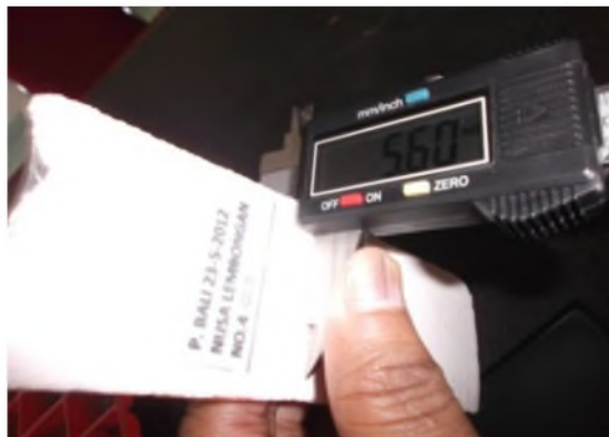
Gambar 3. Pengukuran tebal terumbu karang no. 4.