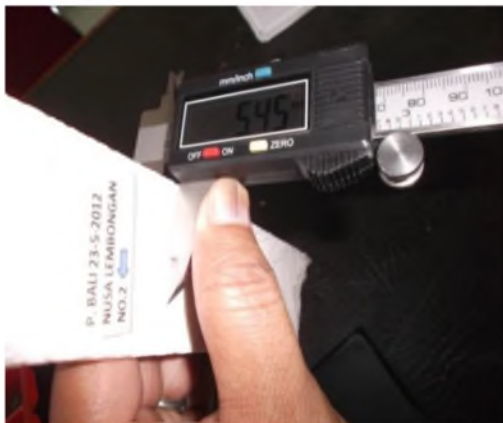
Gambar 2. Pengukuran tebal terumbu karang No. 2.